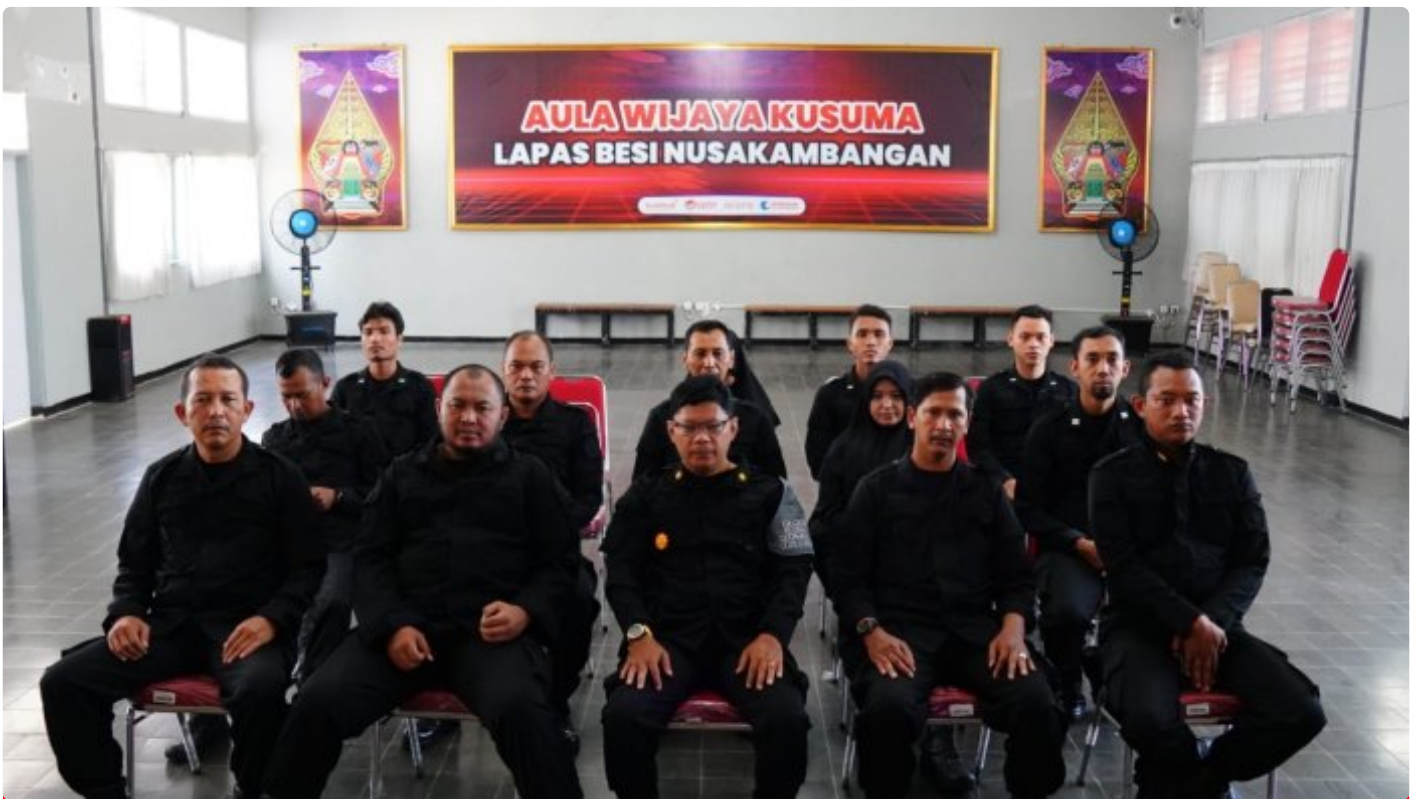
Lapas Besi Ikuti Sosialisasi Konversi Penilaian Kinerja Jabatan Fungsional

CILACAP – Lembaga Pemasyarakatan Kelas IIA Besi Nusakambangan mengikuti kegiatan Sosialisasi Konversi Penilaian Kinerja Pegawai Menjadi Angka Kredit dalam Jabatan Fungsional, (01/02/2024).